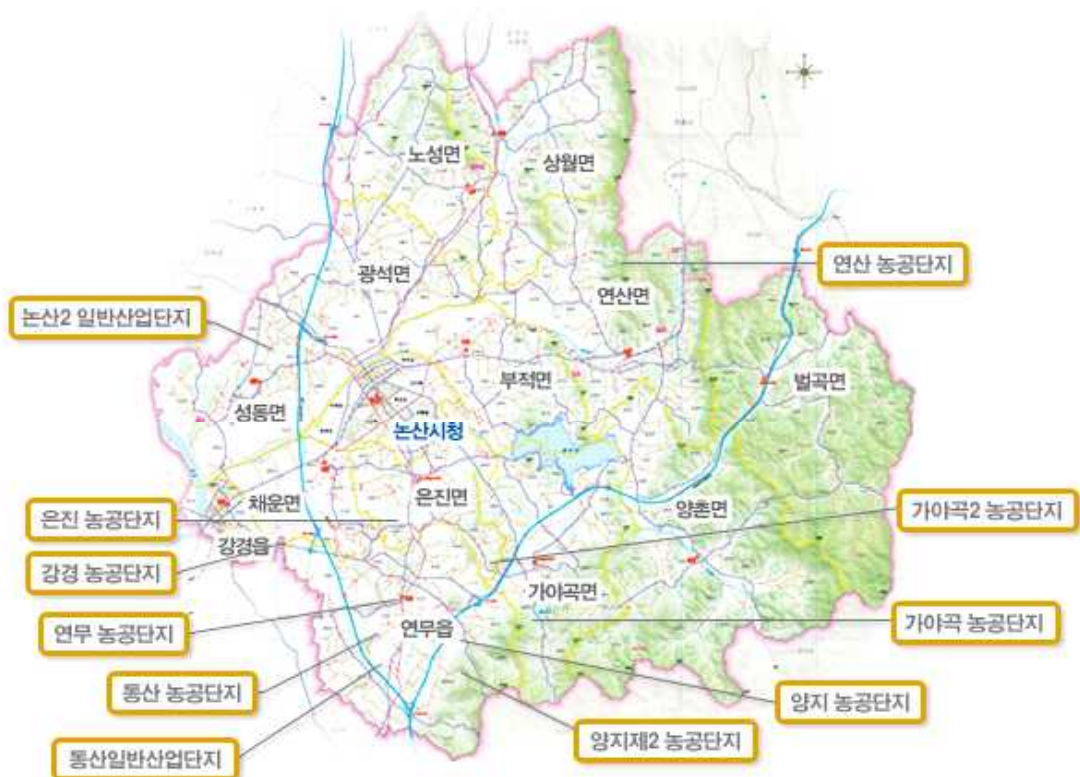
그림3-69 산업/농공단지 위치도